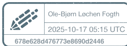
Ole-Bjørn Løchen Fogth