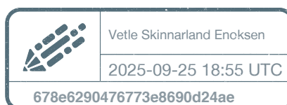
Vetle Skinnarland Enoksen